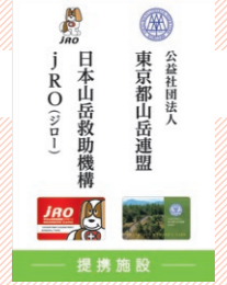
施設に掲示されるプレート