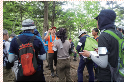
自救力アップ講習会