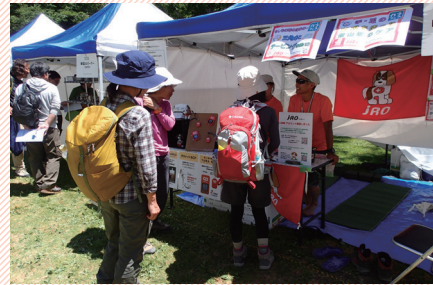
山岳イベント出展風景