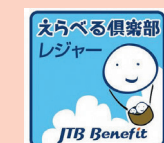
会員証シール見本

詳しいご利用方法はjROホームページまたは更新時に送付される会員証等に同封されているパンフレットチラシ(注)をご覧ください。 (注)パンフレットチラシに、JTBベネフィットの会員証シールが添付されています。 2018年9月以前にご入会の方は、こちらをjROの赤い会員証に貼ってご利用ください。 ※記載内容は、2019年3月現在の情報です。ご利用時点でサービス内容が変更になっている場合もございます。詳しくは、jRO by えらべる倶楽部 会員専用サイトをご覧ください。