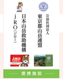
施設に掲示されるプレート